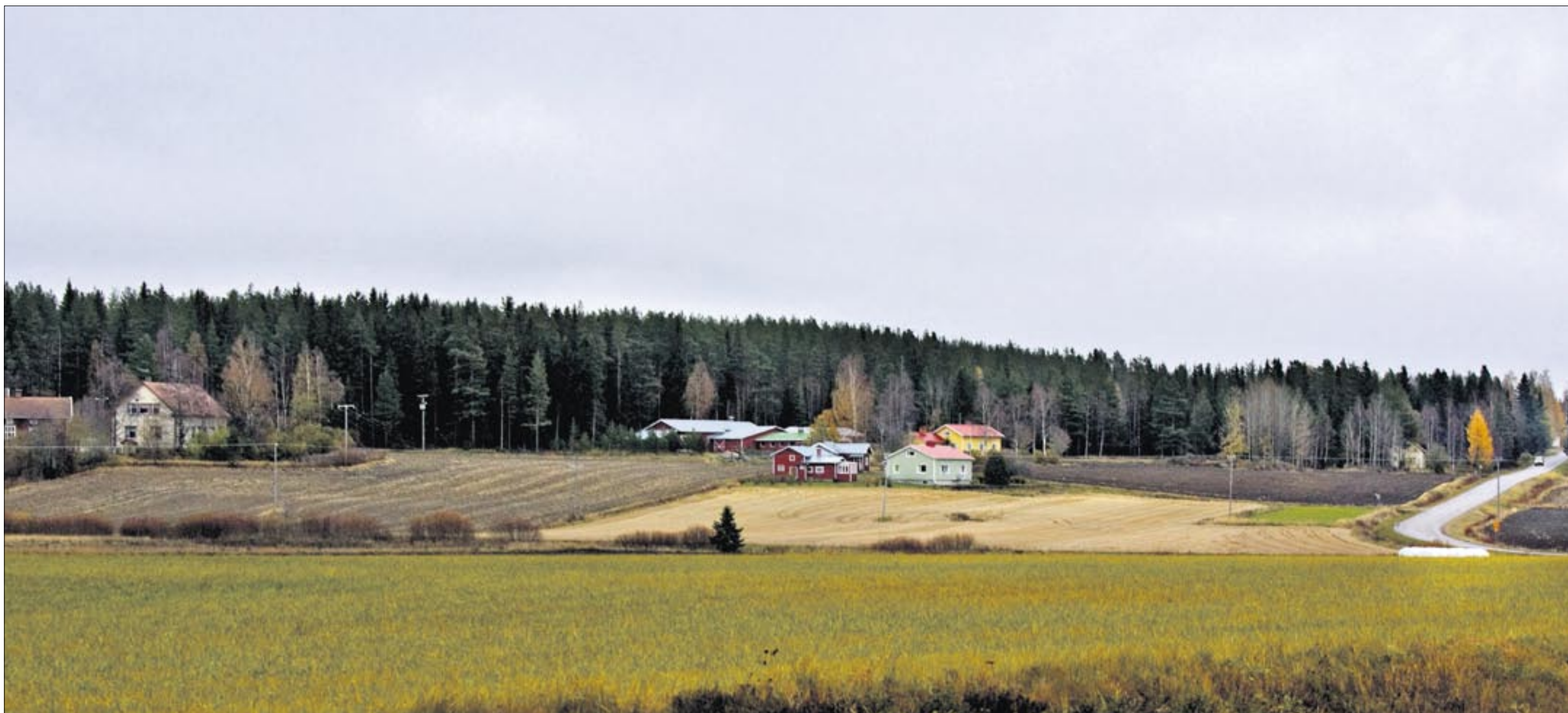
Nopankylä on maastoiltaan hyvin vaihteleva kumpareineen ja notkelmineen. Luonnossa näkyvätkin selkeästi eri vuodenajat. Maaston korkeuserojen vuoksi lumikin tulee alueelle varhain ja viipyy myöhälle kevääseen.