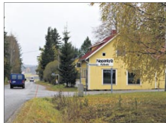
Nopankylän sydämenä on kolmen tien risteyksessä sijaitseva kylätalo, jossa on kuntosali, nuorisotilat ja siellä pidetään erilaisia juhlatilaisuuksia sekä kokouksia.