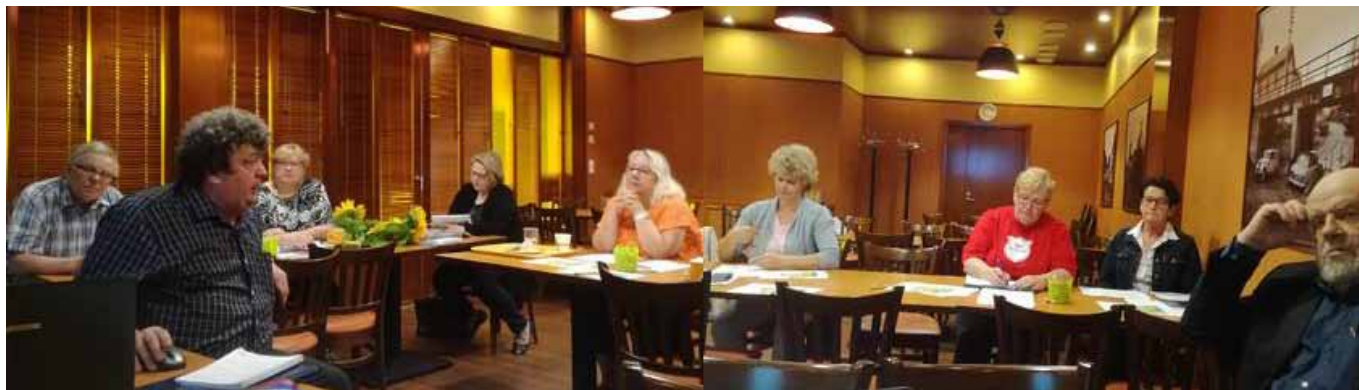
Hallituksen yhteinen laatulauantai pidettiin kesäkuussa Lapualla.

Kertomusvuonna on tehty valtakunnallista laatutyötä sekä Suomen Kylät ry:ssä että maakunnallisissa kyläyhdistyksissä. Eteläpohjalaiset Kylät on valmistellut toimintakäsikirjaa ja osallistunut asiasta järjestettyihin koulutuksiin. Lisäksi on kehitetty edelleen viestintäjärjestelmää ja päivitetty osoiterekisteriä.