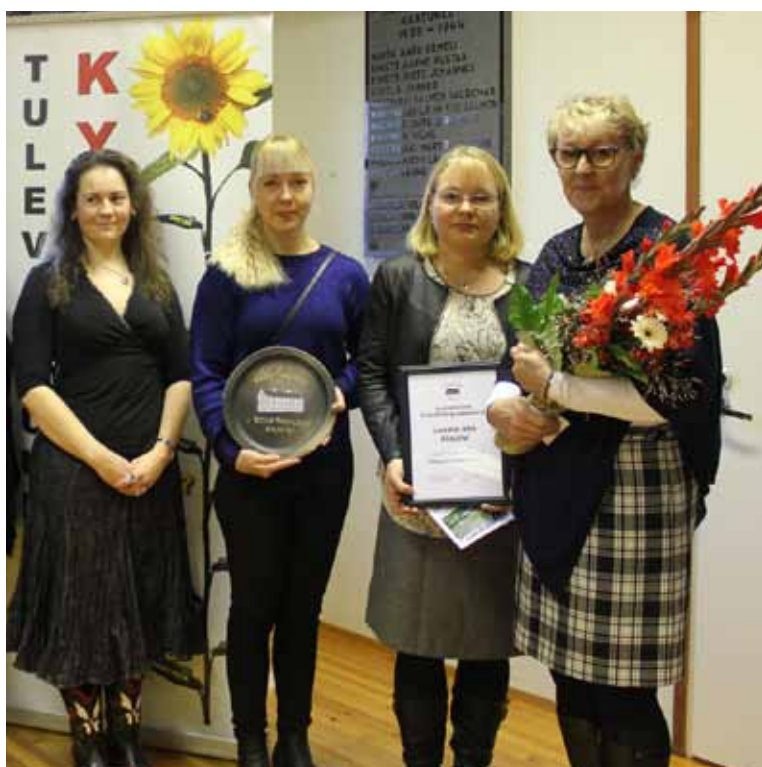
Alajärven Luoma-aho on Vuoden eteläpohjalainen kylä.

Näillä toimin ja kumppanuuksien kautta on yhdistyksen toiminta pyritty keskittämään olennaiseen: eteläpohjalaisten kylälienen huolen- ja puolenpitoon. Yhdistyksen näkyvyys ja painoarvo ovat lisääntyneet.