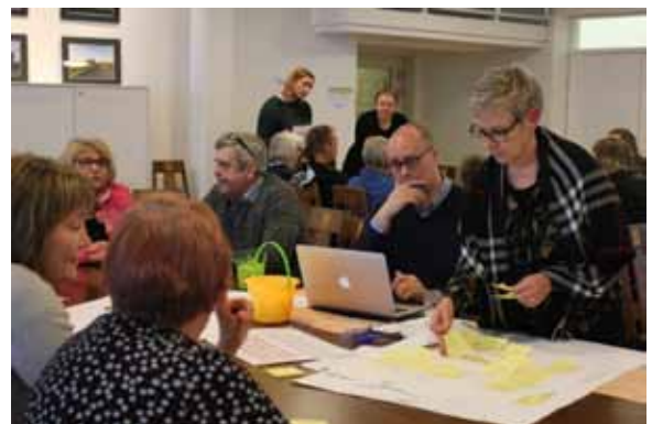
Tulevaisuuden kylä -seminaareissa pidettiin mittavat työpajat, joiden tulokset päätyivät suoraan maakuntavalmistelun käyttöön.