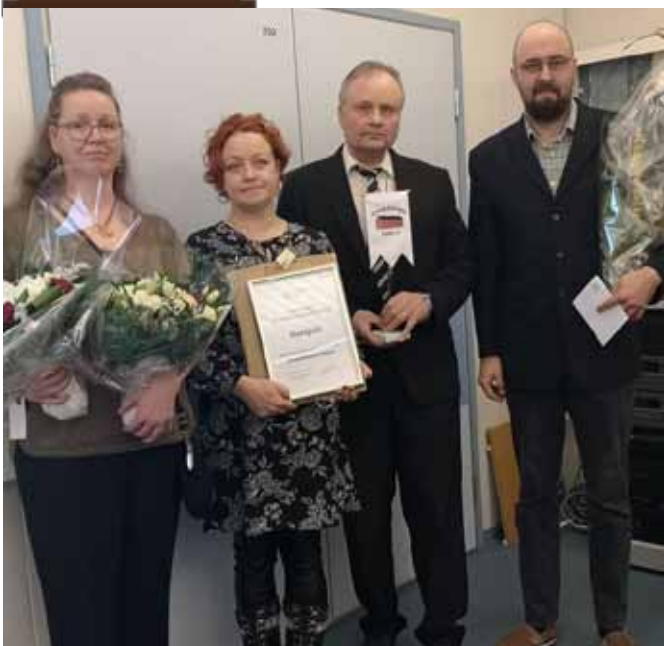
Etelä-Pohjanmaan uusi Vuoden kylä on Ilvesjoki.