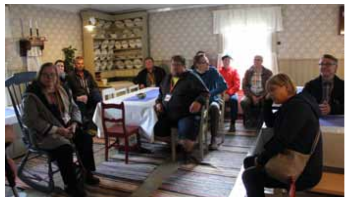
Lauantain retkeläisiä Härmä-seuran kotiseututalolla.