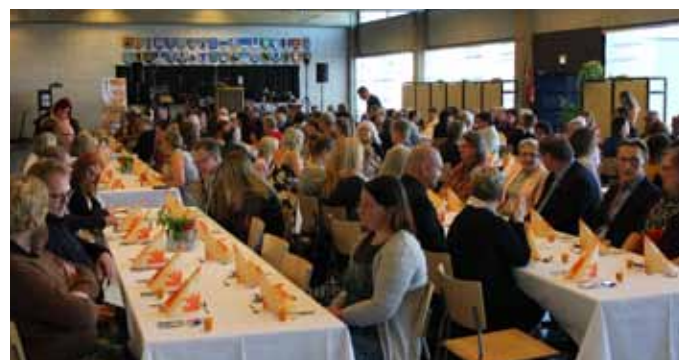
Illtagaala täytti entisen lentosotakoulun sotilaskodin salin.