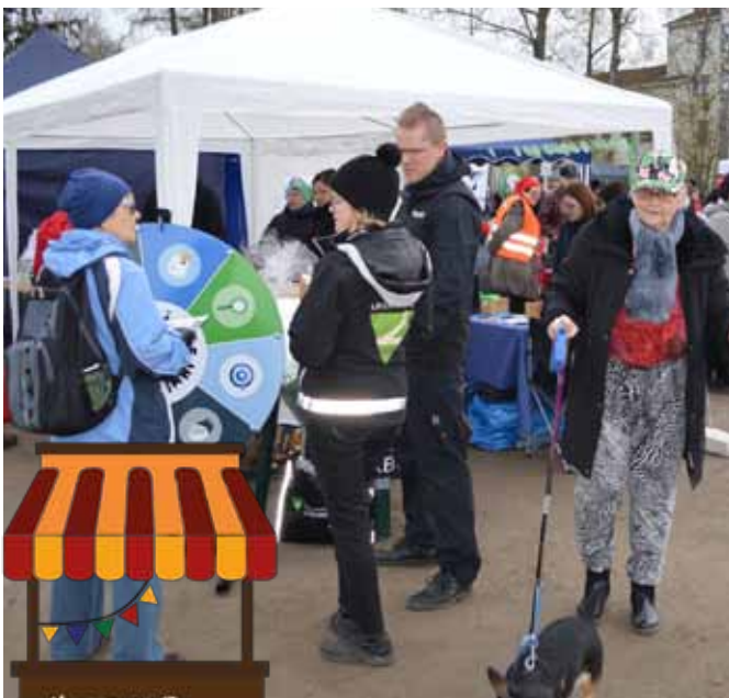
Järjestöjen palvelut tulivat tutuiksi.