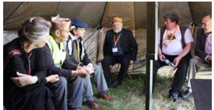
Illalla kuultiin kylähullun jorinoita ja tarinoita teltoissa.