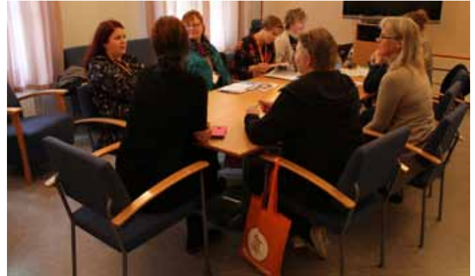
Lokaali käynnistettiin työpajapäivällä.

Yleisöä oli kaikissa tapahtumissa kiitettävästi paikalla ja tietoisuus järjestöjen tarjoamasta toiminnasta ja palveluista lisääntyi. Järjestöt ovat jo kaista varten: #muavarten.